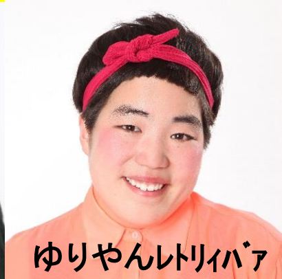
ゆりやんレトリィバァ