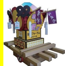
巨大ダンボール太鼓台

駐車場は文化センター・市役所駐車場等が使用できます。台数に限りがありますので、乗り合わせてお越しください。