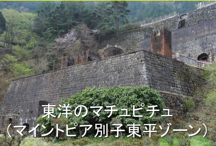
東洋のマチュピチュ (マイントピア別子東平ゾーン)